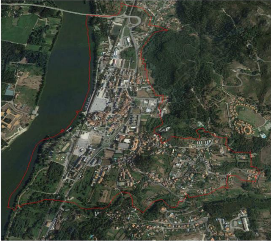
— Área a cartografar