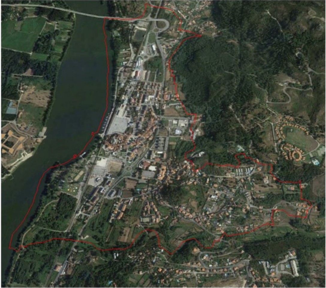
— Área a cartografar