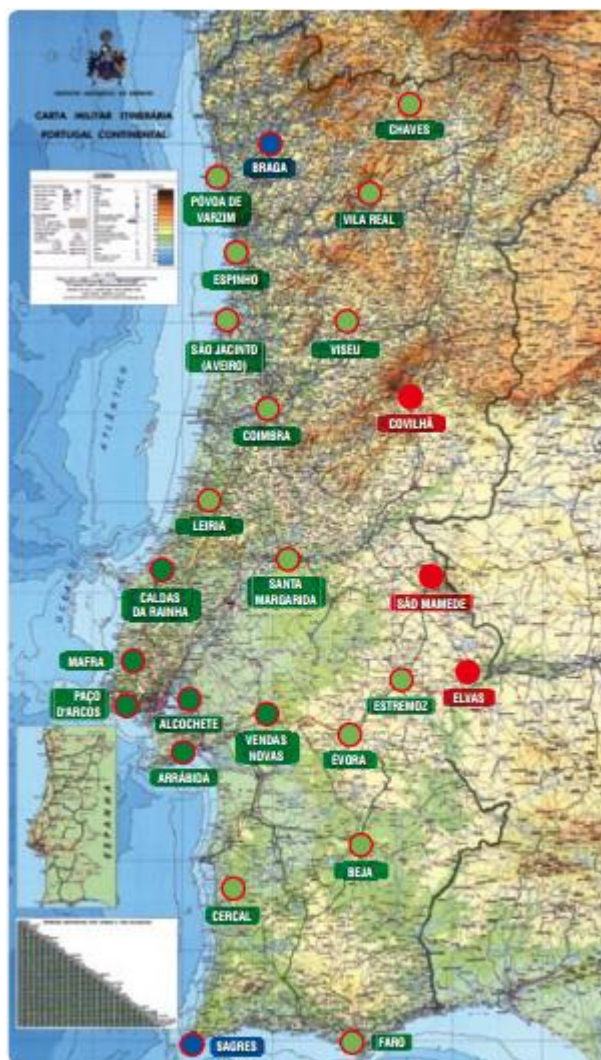
Estações GNSS da rede SERVIR